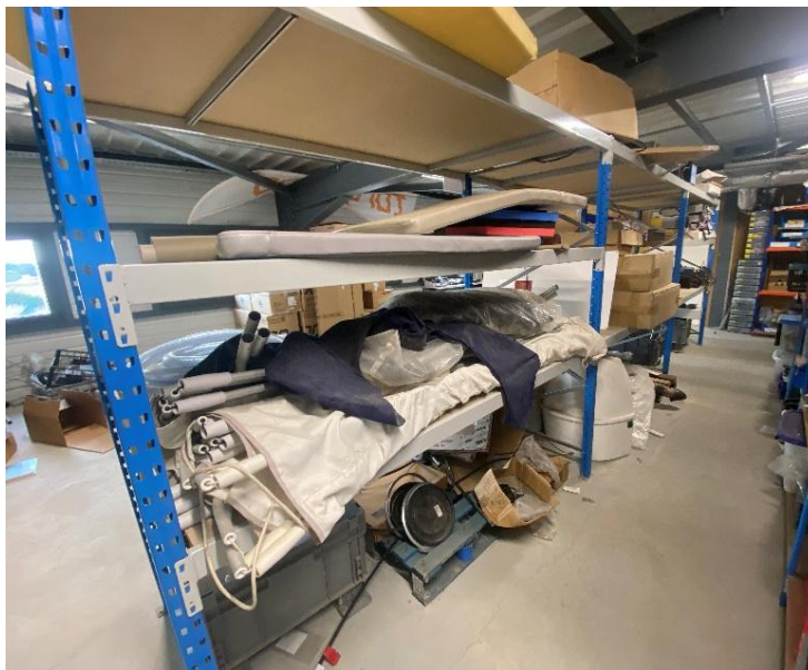
6 mètres linéaires étagères lourde charge