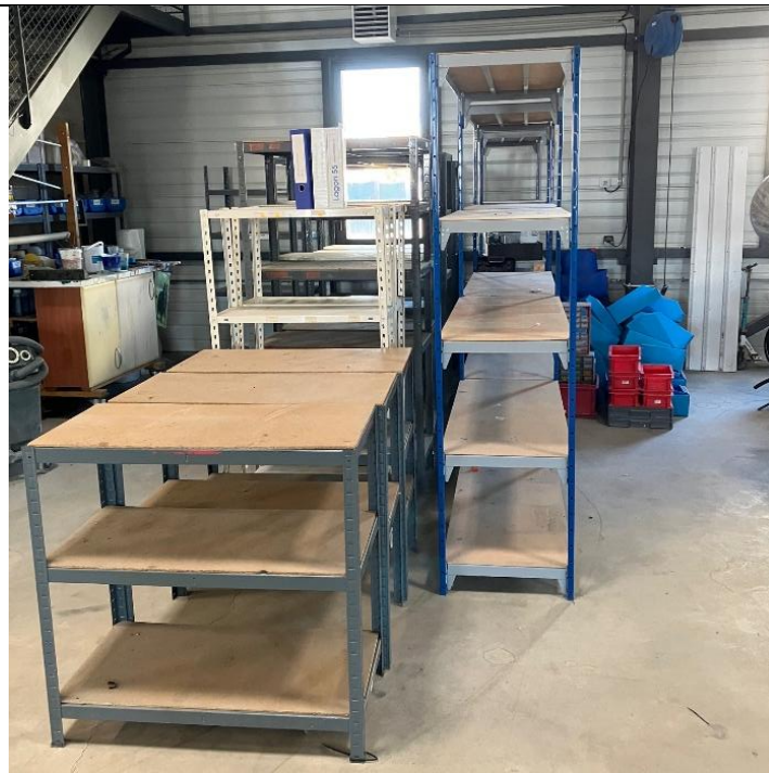
1 grande table haute d'atelier structure métal plateau en bois compacté