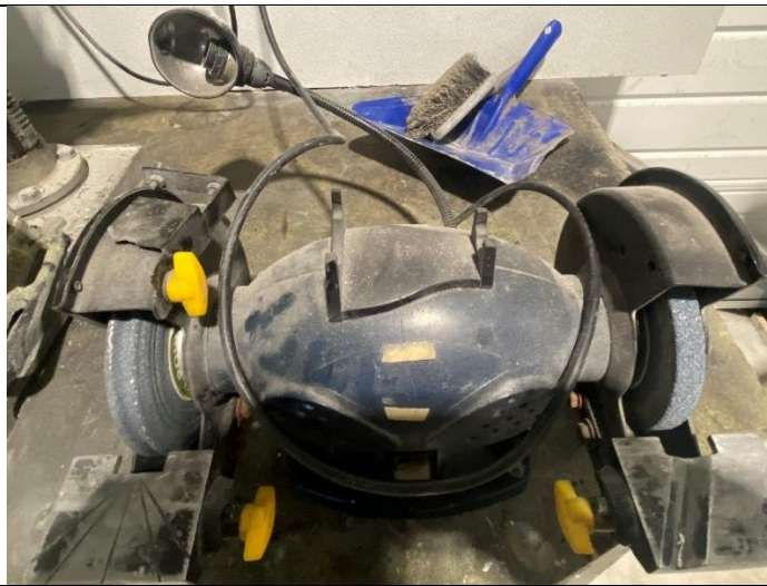
1 scie à ruban manuelle SIDAMO SR100 sur son chariot roulant