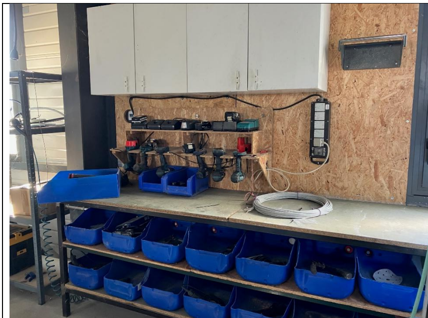
1 palox à câbles