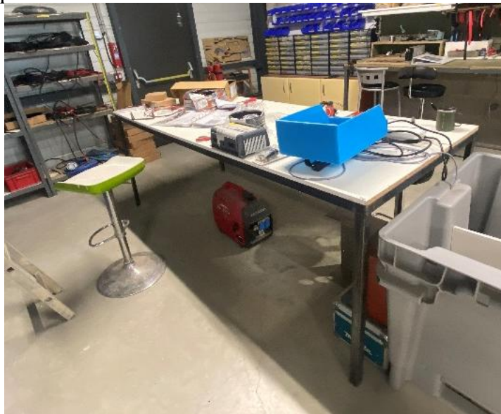
1 établi sur roulette