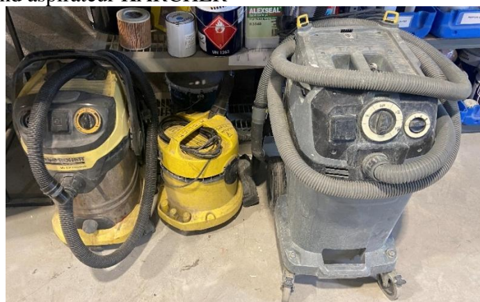
1 grand aspirateur KARCHER